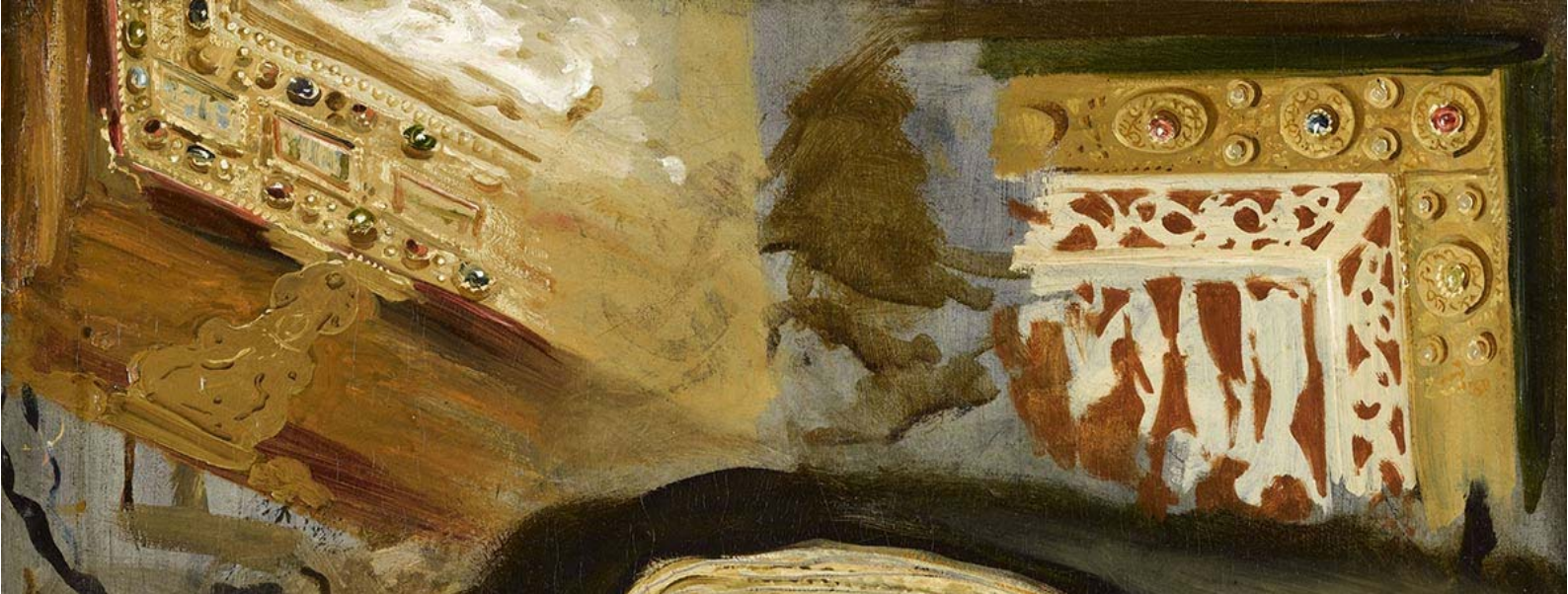
Eugène Delacroix, Etude d'après un des Caprices de Goya, deux plats de reliure médiévaux et une veste orientale