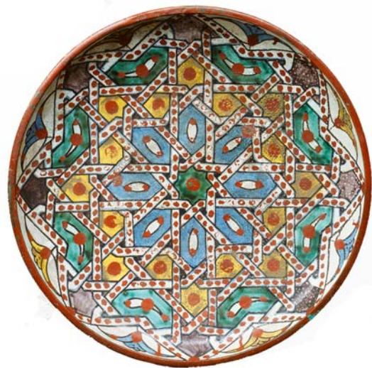
Plat rond (tobsil) céramique de Fès faïence polychrome rehaussée de minium Diamètre : 31 cm Paris, musée national Eugène Delacroix