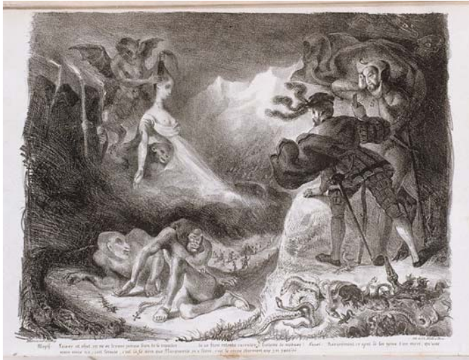
Eugène Delacroix L'Ombre de Marguerite apparaissant à Faust 1827 Lithographie sur papier - 3 ème état 26 x 25 cm Paris, musée national Eugène Delacroix