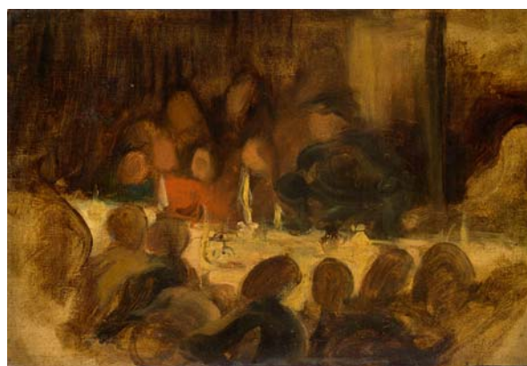
Eugène Delacroix Esquisse pour L'assassinat de l'évêque de Liège 1831 Huile sur toile 31,2 x 46 cm Paris, musée du Louvre, en dépôt au musée national Eugène-Delacroix