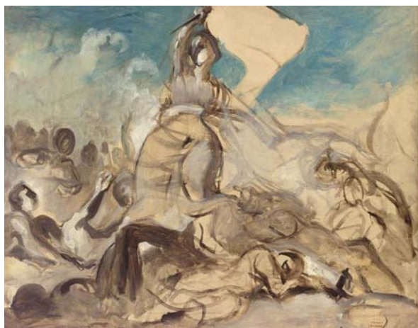
Eugène Delacroix Esquisse pour La Liberté guidant le peuple 1830 Huile sur toile 64,5 x 81,3 cm Collection particulière asiatique, dépôt au musée national Eugène-Delacroix au 1 er novembre 2018