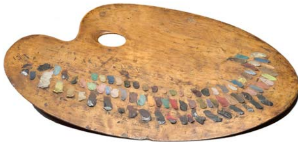
Palette ayant appartenu à Delacroix Bois Diamètre : 47 cm Paris, musée national Eugène Delacroix