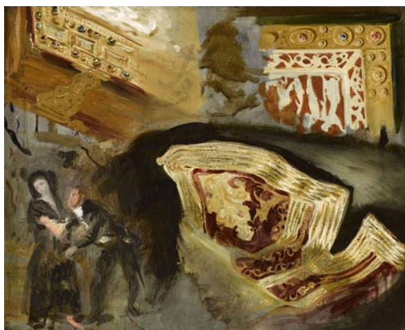
Eugène Delacroix Étude d'après Les Caprices de Goya, deux plats de reliures médiévales et une veste orientale Vers 1825 Huile sur toile 49,5 x 61 cm Paris, musée national Eugène Delacroix

L'utilisation de ces visuels a été négociée par l'Établissement public du musée du Louvre. Ils peuvent être utilisés avant, pendant et jusqu'à la fin de l'accrochage ( 13 juillet 2022 - 31 décembre 2022), et uniquement dans le cadre de la promotion de « Delacroix et la couleur ». Pour un usage web, l'affichage HD n'est pas autorisé et l'image devra être redimensionnée à 1500 pixels sur son plus grand côté. Merci de mentionner le crédit photographique de chaque visuel et d'envoyer une copie de l'article à : fannie.germain@louvre.fr.