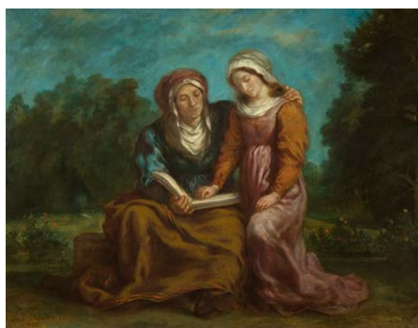
Eugène Delacroix L'Éducation de la Vierge 1842 Huile sur toile 95,4 x 124,9 cm Paris, musée national Eugène Delacroix