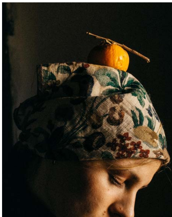
Chloé & Kaçi, Torre Pellice 2020 - Série Insolations © Antoine Henault

Pour cette édition 2022, l'artiste Antoine Henault est invité à exposer ses photographies en résonance avec les couleurs de Delacroix. Le photographe propose un ensemble d'images aux découpes solaires, dont la disposition dans l'espace du musée recompose le rythme des saisons. Ses photographies, captées dans la diversité des paysages et des êtres qu'il rencontre, incarnent la nostalgie de la lumière, la torpeur d'un après-midi, l'ombre et le repos. La couleur y intervient comme mémoire synesthésie en invoquant des perceptions radieuses.